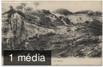
Pantin - Les falaises. 2FI/330 carte postale N/B

Registre des délibérations. - Perception de droits de voirie (n° 21 page 130R). 976 , 6 mai 1839 délibération du conseil municipal