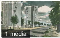
Les Courtilières, avenue de la Division-Leclerc. 2FI/1176 carte postale

Registre des délibérations. - Troisième phase de restauration de la mairie, façades latérales : soumission Puech (pag.. 7W/55 , 10 décembre 1963 délibération du conseil municipal