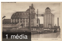
207. Pantin - Les moulins. 2F1/982 carte postale N/B

Personnel communal : dossiers administratifs de LEF à LOM. 663W/23 , 1976-2014