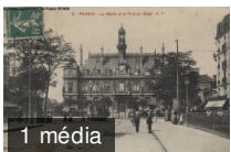
2. Pantin - La mairie et le pont du canal. 2FI/669 carte postale N/B

Personnel communal : dossiers administratifs (de ASS à BAR). 646W/4 , 2002-2013